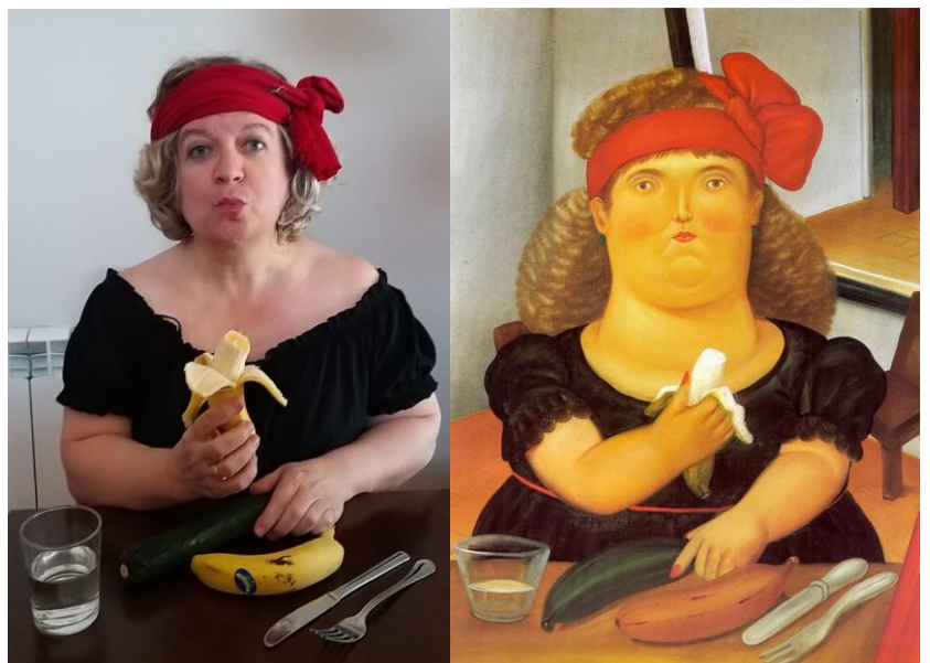
Mujer comiendo una banana. Fernando Botero